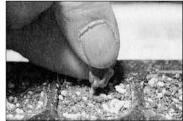
トウモロコシのタネはとんがりの方を下に播く

トウモロコシの発芽名人になる 溝底播種で1カ月早出し、発芽率アップ 穴底播種で育苗いらずのラクラク早出し 1週間冷蔵、じっくり催芽で芽出し揃う やってみました！とんがり下播き▼ 発芽のポイントは水分 水稻育苗箱をかぶせる―吸水処理、 かん水不要で発芽揃う オクラ―播種後の水溜で100%発芽 ニンジン―葉物野菜との混播 鎮圧で水分保持／ゲル被覆種子 タネ播きをラクにする道具 播種穴あけ器 鎮圧ローラー、播種器など