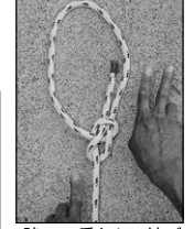
強い二重もやい結び

これが基本 3種のヒモと4つのカンタン結び 巻き結び、引き解け結び、外科結び、ひばり結び